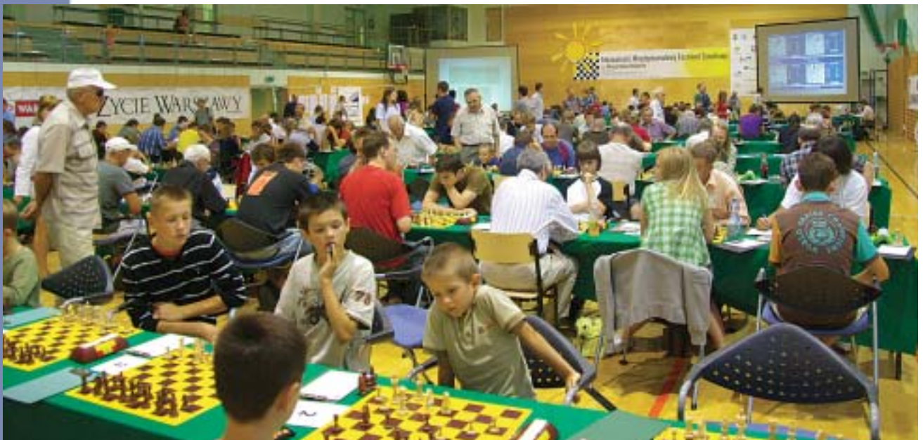
Mazowiecki Festiwal Szachowy, OSiR Polna, Warszawa 2008.