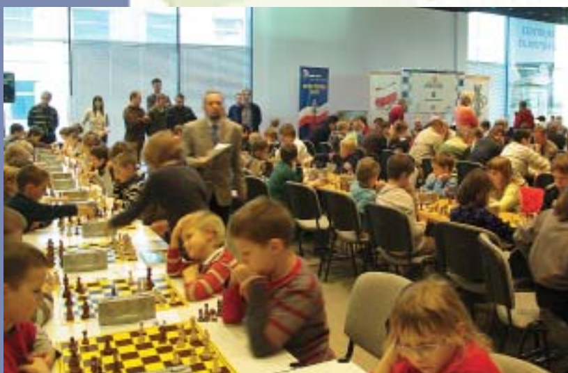
Grand Prix PKO BP 2008, Centrum Olimpijskie, Warszawa 2008.