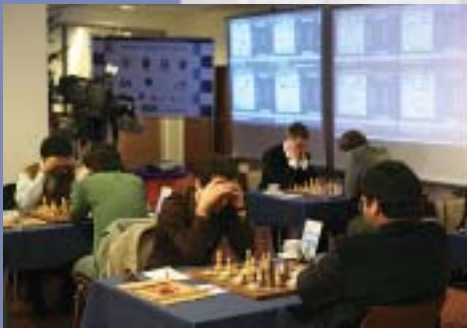
Sala gry w Hotelu Novotel w Warszawie.