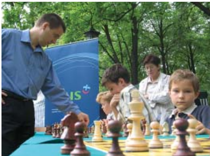
Symultana szachowa z am Bartoszem Soćko. Ogród Saski, Warszawa 2006.