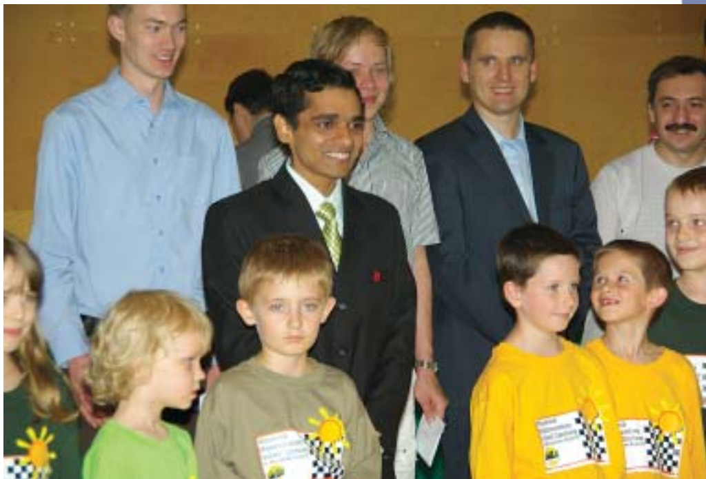
Najwybitniejsi arcymistrzowie i najmłodszy uczestnicy Mazowieckiego Festiwalu Szachowego im. Mieczysława Najdorfa. Warszawa, 2008.