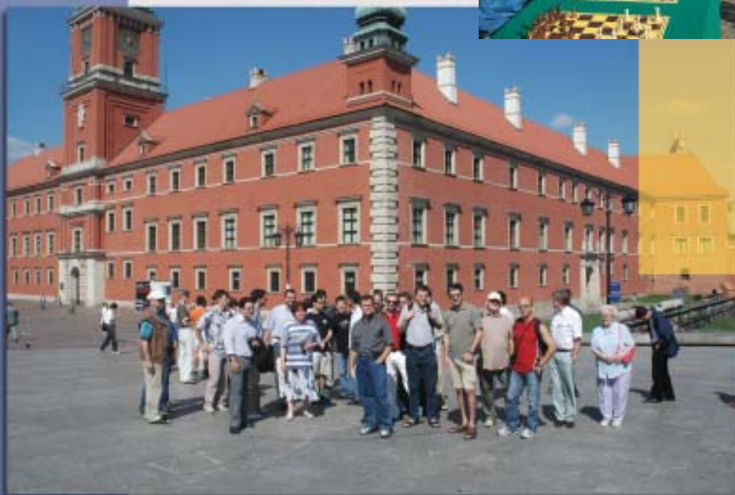
Uczestnicy Mistrzostw Europy 2005 zwiedzają Warszawę.