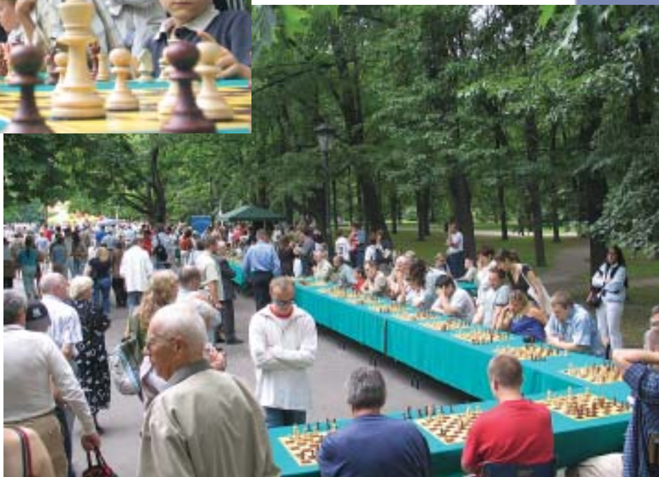
Symultana dla uczczenia 86 Rocznic Bitwy Warszawskiej, Ogród Saski, Warszawa 2006.