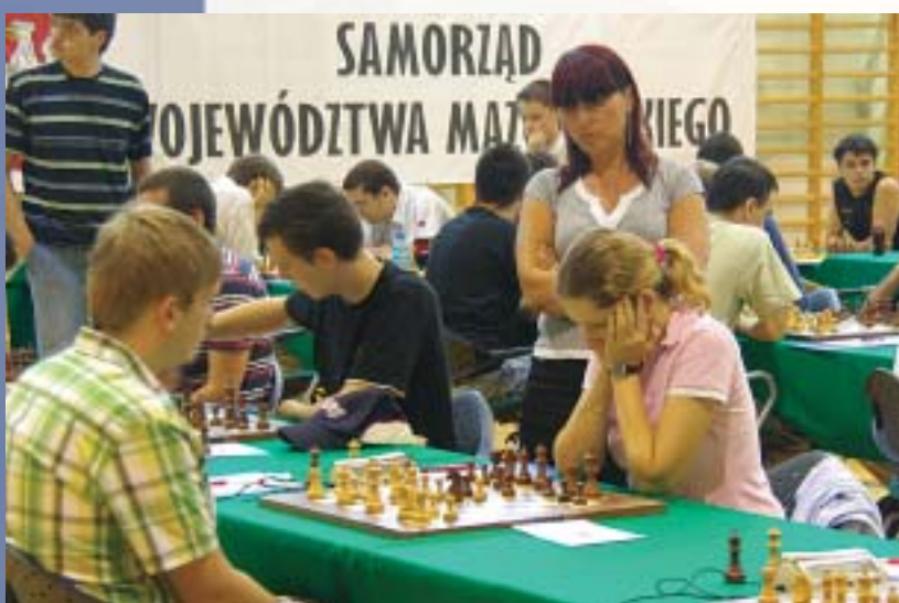
Mazowiecki Festiwal Szachowy im. Mieczysława Najdorfa. Warszawa 2008.