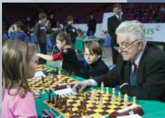
Szachy są sportem bez barier pokoleniowych.