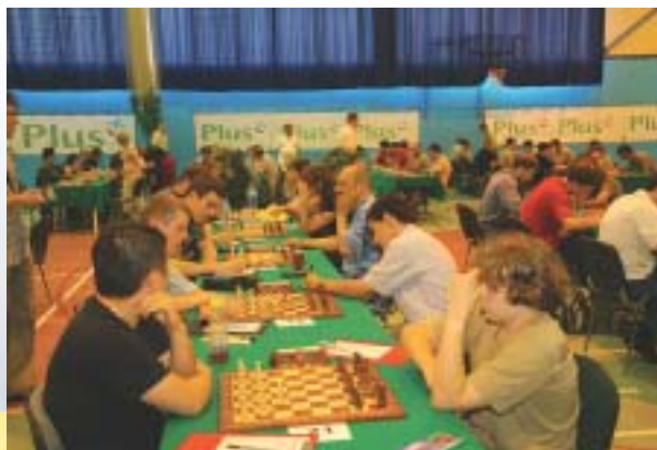
Mazowiecki Festiwal Szachowy im. Mieczysława Najdorfa, Grodzisk Maz. 2007.