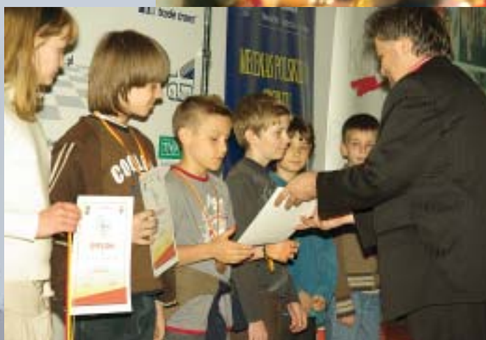
Najmłodszy laureaci WOM.