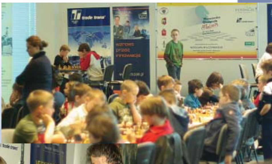
Warszawska Olimpiada Młodzieży, Centrum Olimpijskie, Warszawa 2008.