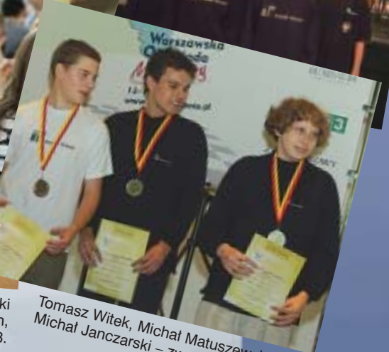
Michał Janczarski – mistrz Polski w szachach szybkich, Lublin 2008.